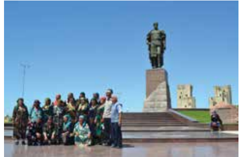
Armi Timurs „Familie“ 4

Familie in der Nähe von Shakrisab. Timur 4: Im 15. Jahrhundert errichtete Timur ein Reich, das von Delhi bis Istanbul reichte... weil er auf Bitten des spanischen Königs den Türken in den Rücken fiel, die erstmals vor Wien gestanden hatten. Sein Palast maß 1000 x 400 Meter und wird zur Zeit freigelegt. Auf Grund des Mangels an flächendeckender historischer Bausubstanz