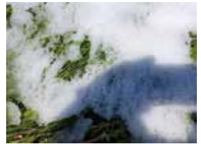
Schnee im April

Neben den gut ausgestatteten Zimmern (alle mit Dusche oder Badewanne und Toilette) und dem üppigen Platz in mehreren Zim-