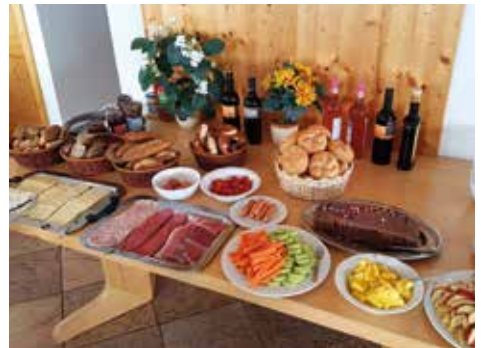
Unser Frühstücksbuffet – im Hotel wäre die Auswahl auch nicht besser!

mern waren die Highlights dieses Hauses sicher auch der Kinosaal, der stabile Kicker und der Billardtisch. Wie wir feststellen konnten, ist es problemlos möglich, außer einem Kinofilm in der Gruppe auch Videospiele auf der großen Leinwand zu erleben... Aber auch von Hand animierte Plüschhasen zum Vorleseabend können unsere Kinder genauso faszinieren.