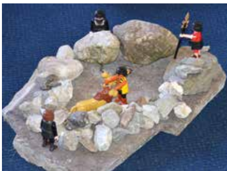
unten: Daniel in der Löwengrube oben: Andacht am Sonntagmorgen

Die Andacht am Sonntagmorgen mit dem Thema „Daniel in der Löwengrube“ genoss rege Beteiligung gerade auch der Kinder, was eventuell auch daran liegen könnte, dass unser Daniel sehr plastisch vor ihren Augen auf den Teppich in die Löwengrube gesetzt wurde. Aber wie man sieht, braucht es kein Kreuz an der Wand, einfach nur ein paar Kinder, die wissen, dass zu einer Andacht auch ein Kreuz gehört und mit ein paar Steinen ist es schnell gelegt.