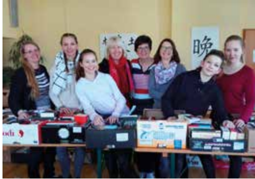
Vielen Dank an die fleißigen Helfer