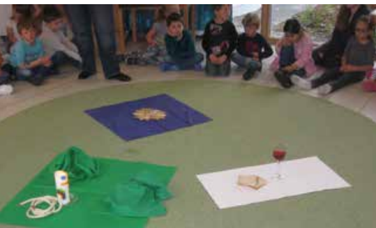
Bodenbild im Foyer-Plenum

Nicola Langton/ Fachkraft für Religionspädagogik