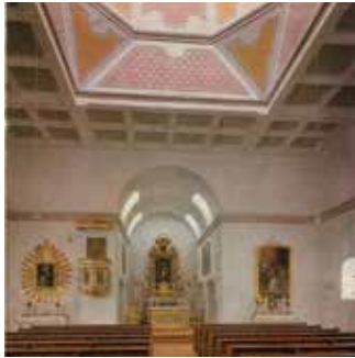
Lorettokapelle mit Hochaltar